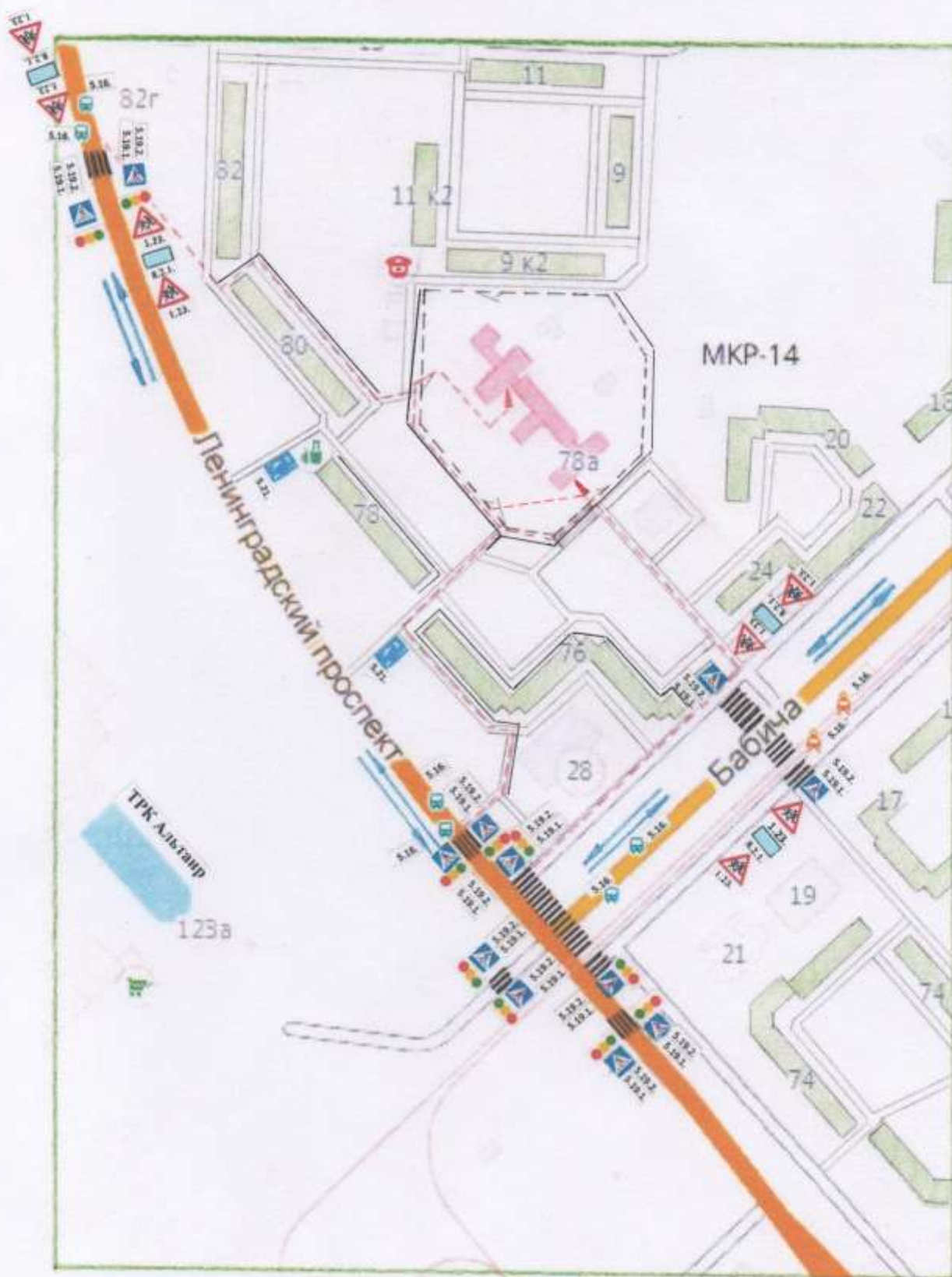
1.1. План-схема района расположения ОУ, пути движения транспортных средств, воспитанников и родителей (законных представителей).