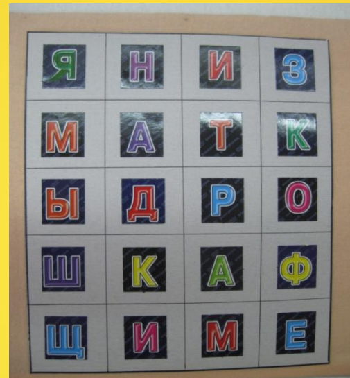
«Найди слово и прочитай»