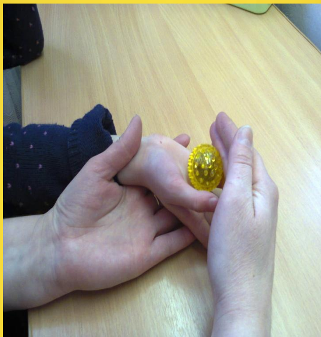
массаж су-джок массажёром (шариком)