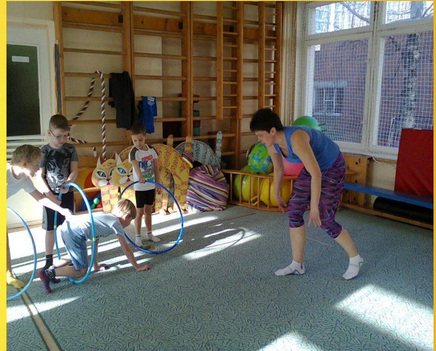
Инструктор по физической культуре