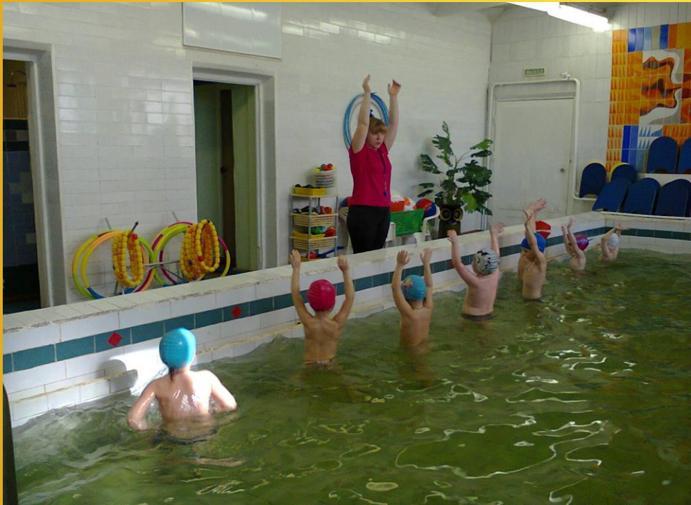
Инструктор по плаванию