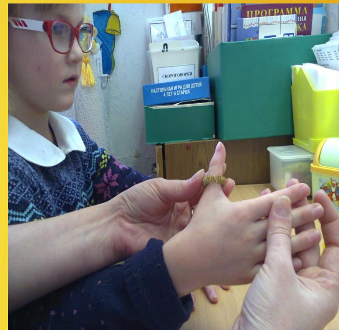
массаж су-джок массажёром (колечком)