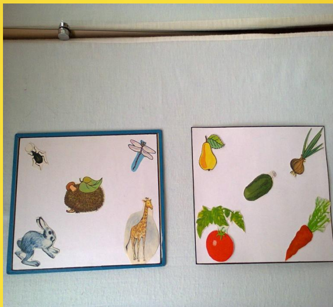
«Где находится предмет»