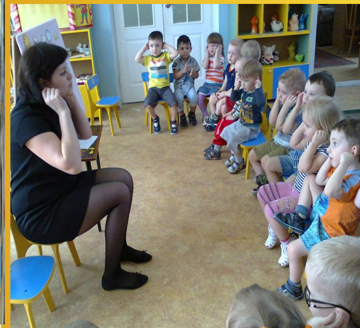
самомассаж ушных раковин