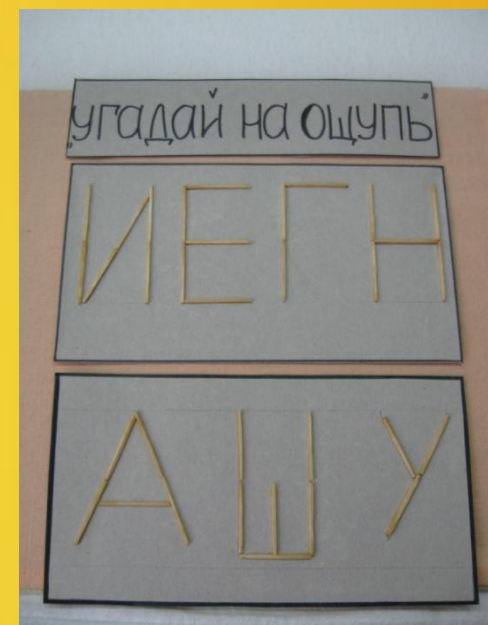
«Угадай на ощупь»