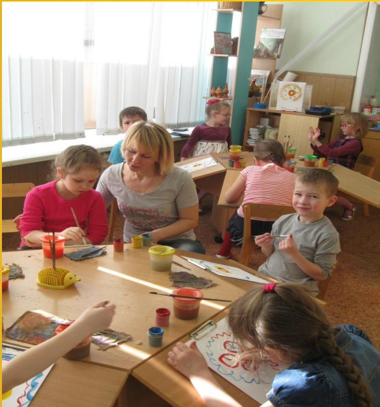
Педагог по ИЗО деятельности